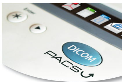
Interface minimale et efficacité maximale.

Print-in est également la solution pour intégrer vos comptes rendus sur des CD d'imagerie.